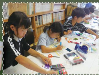
ゆらゆらランタン