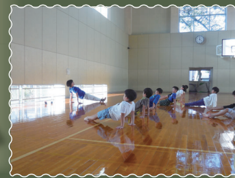
コア・キッズ体操