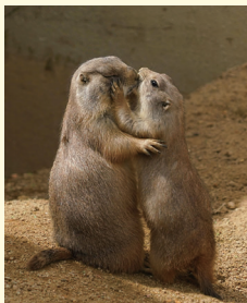
動物園フォトコンテスト最優秀賞 「あなたに夢中」