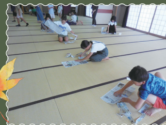
遊びのチャンピオン