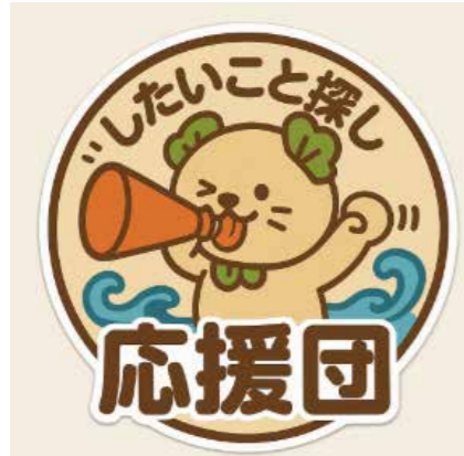
▲AIが作成したイラスト

指示内容① ゆるキャラを描いて 中学校で使う 猫 元気系 明るめの色彩 松の葉紋 アクセントカラーは緑 キャラを囲むように「したいこと探し応援団」の文字 丸い書体 「したいこと探し」は小さく 「応援団」は大きく 修正指示① 松の葉型のネクタイに 手にメガホンを持たせて 修正指示② イラストの外枠と文字 波を残して イラストの線を太めに、「応援団」の文字の後ろにこのイラストが入るように メガホンははみ出てもいい