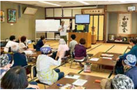
▲公民館で行われたスマホ教室の様子

コミュニティサポーターとは？ 町会や町内会で多世代交流を促す役割を担う人材であり、