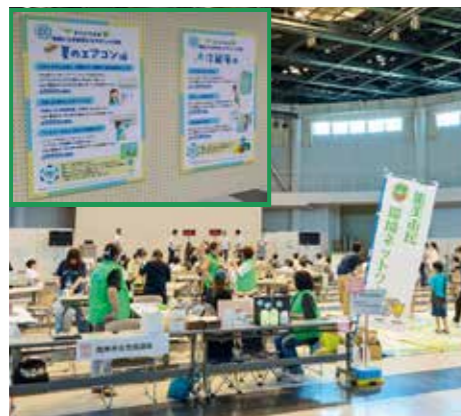
▲のみ環境フェスタ 2025の様子。啓発パネルも展示