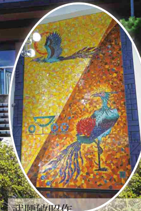
武腰敏昭作 陶壁モザイク「鳳凰の図」