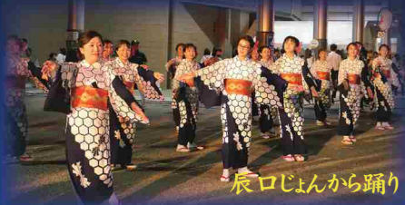
辰口じょんから踊り

じょんから踊りコンクール、 ウルトラマンゼロのショーステージ、 お化け屋敷、打ち上げ花火