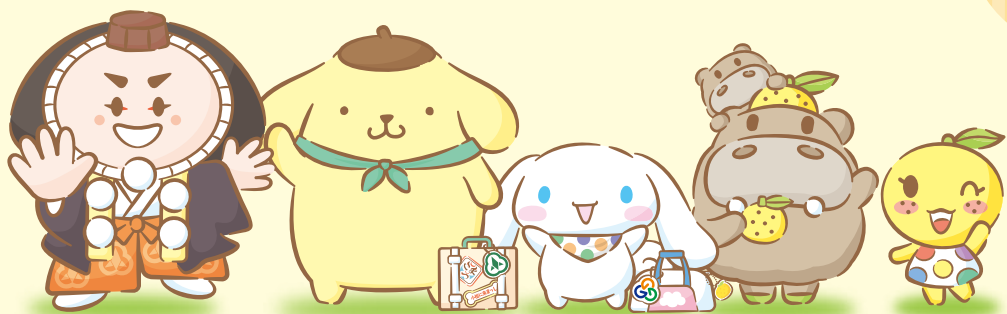
小松市イメージキャラクター カブッキー 小松もう大好き♥隊長 ポムポムプリン 能美市応援大使 シナモロール 能美市公式キャラクター ひぼ能ん・ゆず美ん・ぼぼ能ん (左) (右) (上)