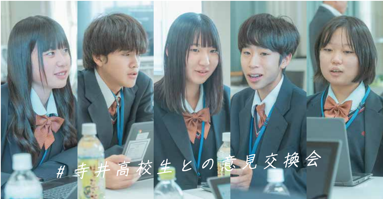
#寺井高校生との意見交換会