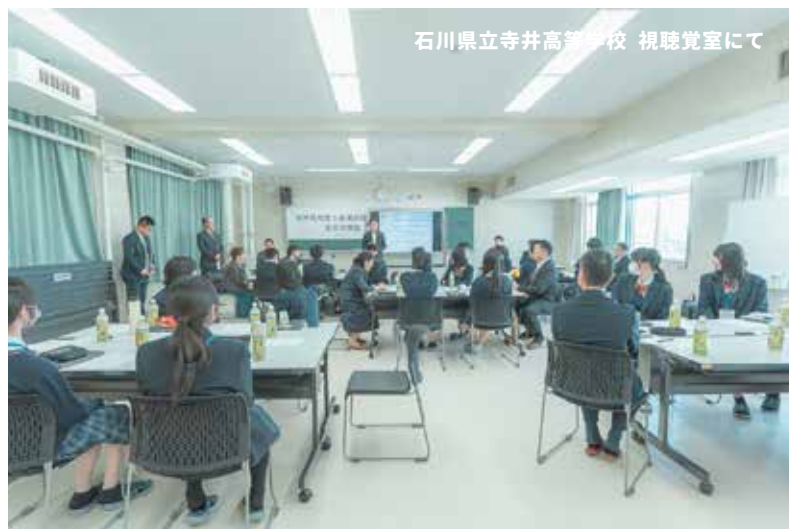
石川県立寺井高等学校 視聴覚室にて