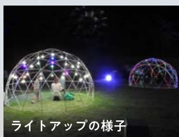
ライトアップの様子

能美の地名誕生を記念し、ライトアップや参加型キャンドルイベントで幻想的な空間をつくります。先着順でライトバルーンを配布予定。煌びやかに光る風船は写真映えすること間違いなし！能美市応援大使シナモロールライトアップも会場できらめきます！