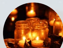
参加型キャンドルイベント ※写真はイメージです

※本事業は「いしかわ百万石文化祭2023公式ガイドブック」 「141古墳シンポジウム及びアート演出」と同事業です。