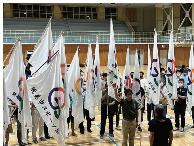
7月12日、寺井体育館で行われた能美市選手団結団式

第74回石川県民スポーツ大会夏季大会がはくろ市を中心に開催されます。能美市からは40競技100部門に総勢815名が参加します。ぜひ皆さんも選手に負けない熱い声援をお願いします。 ▶ 開催日 8月5日 (土)・6日 (日) 詳しくは石川県スポーツ協会のホームページをご覧ください。か、能美市スポーツ協会 (☎ 55-8900) までお問い合わせください。