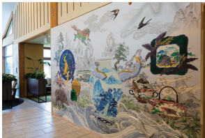
カフェエリア [ 空想器獣山水図 ]