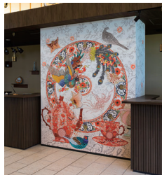
エントランス [ 空想器花鳥図 ]