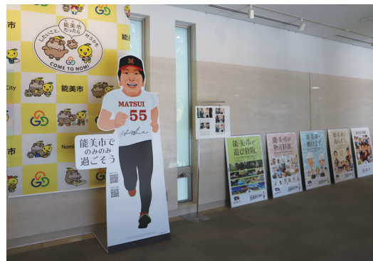
松井さん直筆サイン入りパネルを市役所本庁舎2階に設置

今後、松井秀喜ベースボールミュージアムや能美根上駅、九谷陶芸村、こくぞう里山公園交流館などに撮影スポットとして設置する予定です。