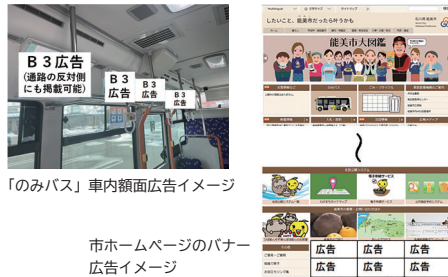
「のみバス」車内額面広告イメージ