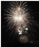
ファイナールの火花

ハッスル賞とは男性の踊りの力強さが評価された団体に、なでしこ賞は女性の踊りの優美さが評価された団体に、チャームング賞は子どもの元気さ、はつらつさが評価された団体に贈られます。