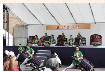
まつりを盛り上げるステージイベント