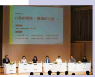
2019年のシンポジウムの模様