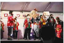
じよんから踊りコンクール表彰式