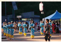
じよんから踊りコンクール

メインイベントのじよんから踊りコンクールには10チーム207人が出場し、踊り子たちがそよ風の浴衣や工夫を凝らした衣装などでまつりの雰囲気を感じていました。審査員が踊りの巧さ、統一性、チームの調和力などを総合的に判断し、総合第1位に輝いたのは「緑が丘町会」でした。ファイナールには色とりどりの火花が打ち上げられ、盛況のうちに幕を閉じました。