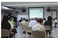
子ども食堂の説明を聞く参加者たち

7月11日、石川県青少年健全育成南加賀ブロック会議が根上総合文化会館で行われ、能美・加賀・川北・小松の青少年育成推進指導員や教育機関関係者など約50名が出席しました。