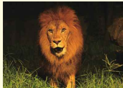
夜は威風堂々とした姿を見せる「クリス」