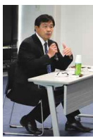
意見を交わす馳知事

が喜ぶ工夫がなされて いる。定期的に展示物 を変えるなどして、よ り多くの人を呼び込 んでほしい」と述べま した。