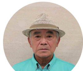
地域の見守り活動に励む

く思っています。 子どもから高齢者まで幅広く地域を見守る活動をしています。活動中は顔を合わせて話をすることを心がけています。直接お宅を訪問し、時には筆談でも対応するなど、さまざまなツールでコミュニケーションを取っています。訪問時にご家族の近況を聞き、元気な様子を知ることができると嬉しい時間です。 和光台は若い人が多く、子どもたちの声がたくさん聞こえます。今はコロナ禍で行事の中止が続いていますが、落ち着いたら再開し、子どもたちのにぎやかな声が聞けたらいいと思います。