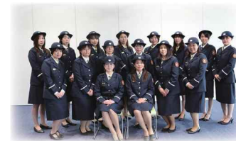
女性分団「能美の女組」発足式

7月下旬に公開を予定していた「のみSDGsホームページ」は8月8日に開催予定の「のみSDGsパートナーズキックオフイベント」に合わせて公開することになりました。