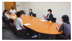
井出市長と語り合う研修生5名

の中で、語り合いました。現在カフェトークの参加者を募集しています。詳しくはホームページをご覧ください。QRコードはコチラ