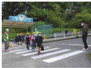
子どもたちの安全を守るため、朝夕の通学路で見守り隊として活動しています

保護者の方も活動に協力してくれているので、とても助かっています。地域の宝である子どもたちを見守り隊だけでなく町民みんなが見守る意識を持つ、そんな町にしていきたいと思っています。 見守り隊の活動は大変なこともありますが、毎年小学校では感謝会を開いてくれ、子どもたちから歌や花のプレゼントをいただくことは活動の励みとなっています。また小学生のときに見守りをしてきた子どもたちが、大きくなってからも、町内で会うとあいさつしてくれたり、声を掛けてくれたりして、その成長を見るのもうれし