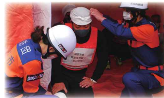
火災防ぎも訓練での活動

誰もが自分らしく活躍し、安心して暮らせる社会をつくるには、女性が能力を発揮し活躍できる場を広げること、女性の意見を取り入れることが必要となっています。これらを後押しするためにも社会全体で女性の活躍を推進することが大切です。性別による役割意識の固定概念にとらわれず、家庭や職場など自分の身近なところで、私たち一人一人の個性と能力を活かすために男女平等を実現していきましょう。