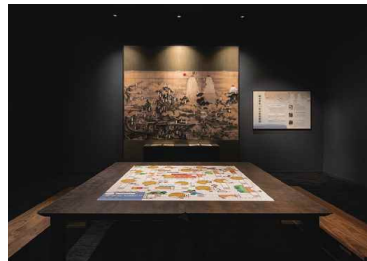
テーマ展示室「白山曼茶羅図が描かれた時代。」