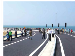
平成30年3月25日、能美根上スマートインターチェンジ（SIC）の開通を記念し、ウォーキングイベントが実施されました

私は平成26年から2年間、吉原釜屋町の町内会長を務めていました。町内会長になった当時、町内の課題となっていたのは、やはり少子高齢化と過疎化でした。 吉原釜屋町は能美市の端に位置し、市の中心街とは離れています。そのため、辺境と思われるかもしれませんが、私は逆に、英語で言うフロンティア、つまり「発展の可能性がある地」と考えています。 この町を魅力ある町にして人口を増やすため、町内で課題を洗い出し、まずは虫食い状態となった休耕田をきれいに整備することになりました。この地は砂丘地