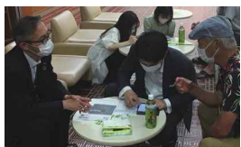
テレマティクスタグとスマートフォン を設定している様子