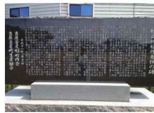
砂丘地稲作発祥の碑

私は平成26年から2年間、吉原釜屋町の町内会長を務めていました。町内会長になった当時、町内の課題となっていたのは、やはり少子高齢化と過疎化でした。 吉原釜屋町は能美市の端に位置し、市の中心街とは離れています。そのため、辺境と思われるかもしれませんが、私は逆に、英語で言うフロンティア、つまり「発展の可能性がある地」と考えています。 この町を魅力ある町にして人口を増やすため、町内で課題を洗い出し、まずは虫食い状態となった休耕田をきれいに整備することになりました。この地は砂丘地