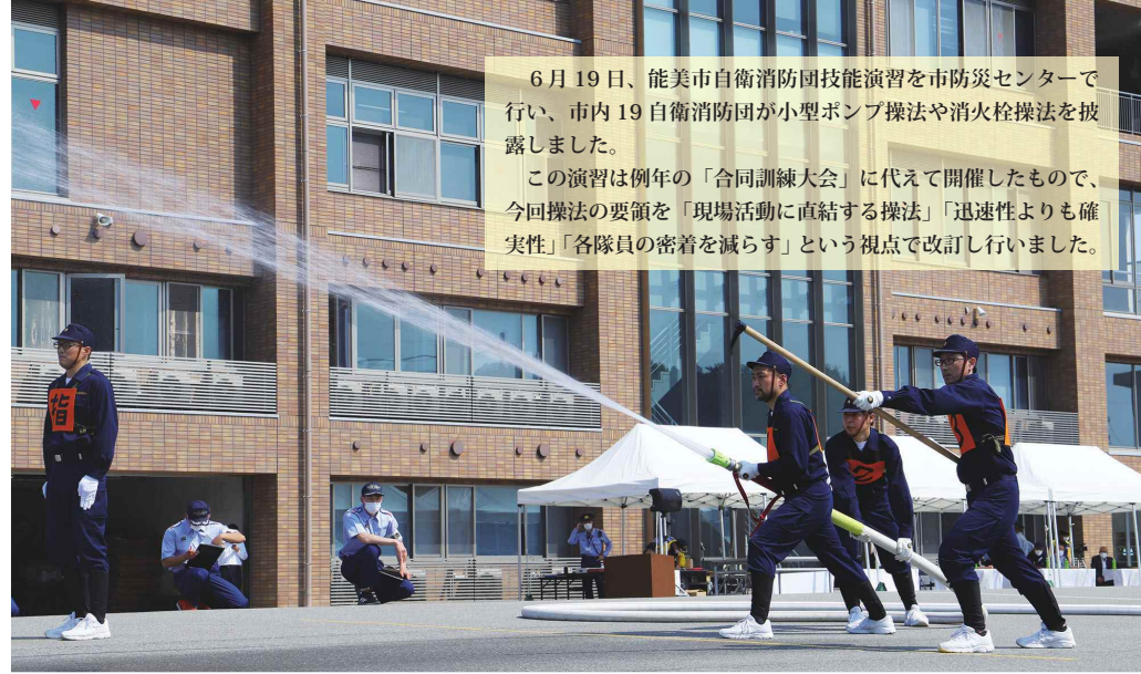
6月19日、能美市自衛消防団技能演習を市防災センターで行い、市内19自衛消防団が小型ポンプ操法や消火栓操法を披露しました。 この演習は例年の「合同訓練大会」に代えて開催したもので、今回操法の要領を「現場活動に直結する操法」「迅速性よりも確実性」「各隊員の密着を減らす」という視点で改訂し行いました。