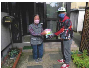
高齢者へ誕生祝いにプレゼントをする活動を行っています

私は職場の先輩であり元民生委員の方からの推薦で、6年前から和光台の民生委員・児童委員を務めています。民生委員として、高齢者や障がいのある方などを訪ね、健康状態や困りごとの相談を受け付けたり、話し相手になったりしています。 また子どもたちの登下校時には、学校近くの横断歩道で見守りを行っています。元気がない子に励ましの言葉を掛けたり、普段と変わった様子がないか注意して見たりし、子どもたちの小さな変化にも気付けるよう目を配っています。今年からは見守り隊のほか、