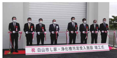
関係者はテープカットで、し尿・浄化槽汚泥受入施設の竣工をお祝いました