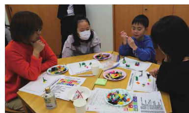
令和2年2月に開催した「まなびフェスタ2020」でレゴブロックやカードゲームを通してSDGsを学ぶ様子

(☎ 58-2272 ☎ 55-8555 ✉ manabi@city.nomi.lg.jp)