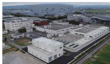
し尿・浄化槽汚泥受入施設