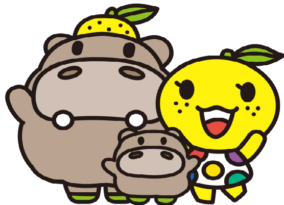
ひぼ能ん ぽぼ能ん ゆず美ん