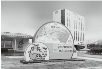
宿泊需要の回復と能美市の魅力発信を

A 石川県内の感染状況等に関するモニタリング指標においてステージ2「感染拡大警報」以上が続く場合、本事業の開始は見合わせる。 予