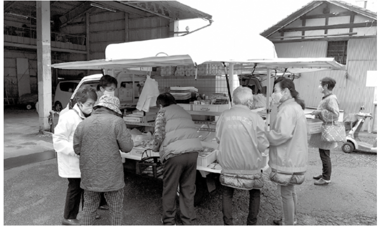
能美市商工女性まちづくり研究会による移動販売の様子