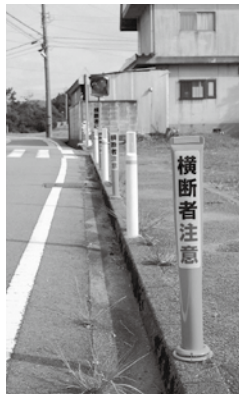
ドライバーに注意喚起