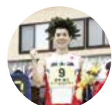
競歩 鈴木雄介選手