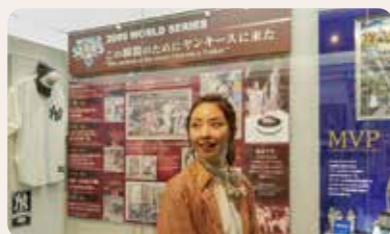
野球にあまり詳しくなくても十分に楽しめます。店内のお土産コーナーも充実。書籍も多い。