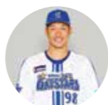
横浜DeNAベイスターズ 京田陽太選手