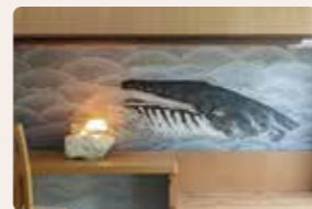
08. 眠りの島 牟田 陽日 [洋室]