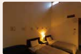
06. 光と線と影 中田 雅巳 [洋室]