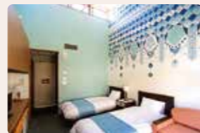
07. 月齢 早助 千晴 [洋室]