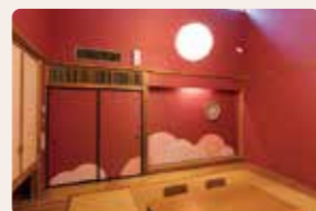
03. 里やまの弧 架谷 庸子 [和室]