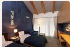
05. 静爽の奏 山岸 青矢 [洋室]