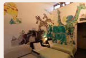
04. 五彩アニマル'z 山近 泰 [洋室]