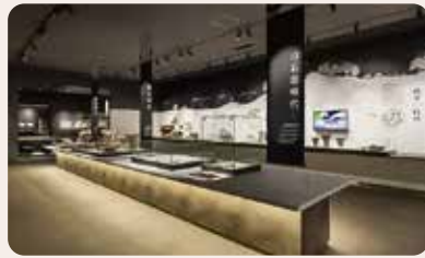
山のめぐみ。狩猟と採集のくらし。 旧石器・縄文時代