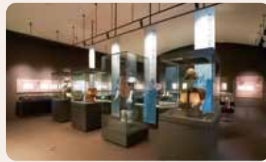
平野と大河川。大きなお墓と国づくり。 古墳時代