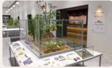
能き美しき能美の自然。 蟹淵 灯台管湿地 セツ滝 手取川 根上海岸