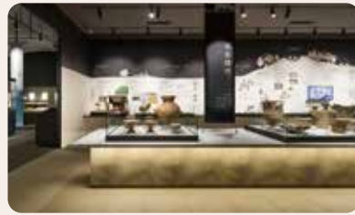
平野にくらす。稲作のはじまり。 弥生時代