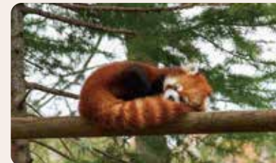
夜行性のため昼間は就寝中のレッサーパンダ