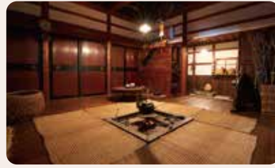
電化製品が広がる前のくらし。 大正・昭和

「能美ふるさとミュージアム」では、国指定史跡能美古墳群の貴重な出土品や、石川県指定文化財「絹本着色白山曼荼羅図」、近現代のくらしを伝える民具など、2 万年以上昔から紡がれてきた悠久の歴史が紹介されています。また、美しい山・平野・海に囲まれた豊かな自然も学べ、能美を総合的に理解することができます。和田山古墳群のふもと、ふるさとを共に知り、未来を育む場として共創していく新しい博物館をめざしています。