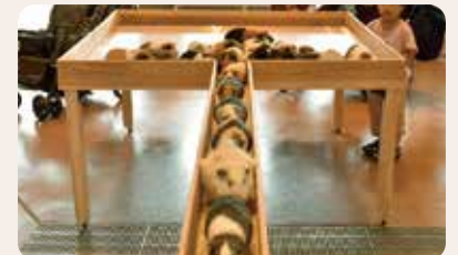
日本海側最大級屋内施設「ふれあい体験館」では、愛くるしいモルモットの行進が見ものです。