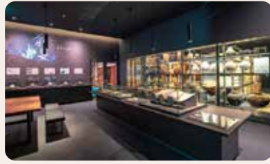
海から山まで。「能美」1200年のはじまり。 飛鳥・奈良・平安時代