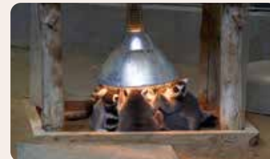
寒いので暖の取れる場所に集まったユーモラスな姿のワオキツネザル

高さ 35m、1周 21m の空中回廊では、真上を歩くアムールトラの肉球を見ることができます。他の動物園にはない施設が「トキ里山館」。エサをついばむトキを間近に観察したり、棚田風の湿地や樹木など里山を再現した環境の中で生活するその暮らしぶりを感じることができます。本州最後の生息地であった石川県に戻ることができました。