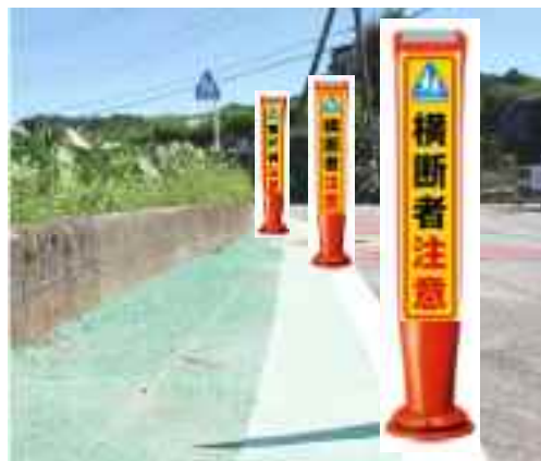
歩行者を知らせるサインポール