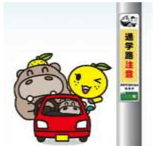
電柱看板のイメージ

交通事故の未然防止のための広告媒体として電柱看板を活用し、能美市交通安全協会と連携して交通安全の啓発を進めます。