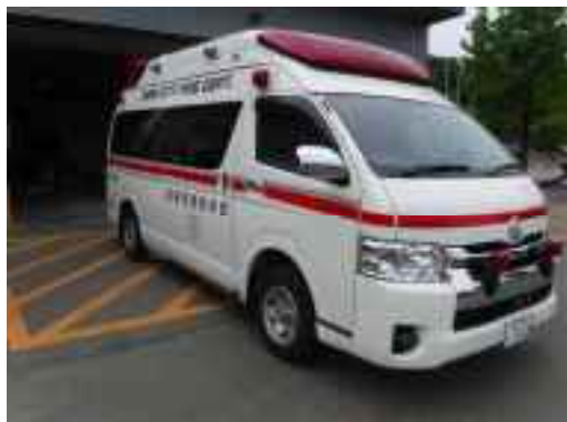
高規格救急自動車のイメージ

高齢化に伴う救急需要の増加を考慮し、また、新型コロナウイルス感染症も含めた様々な感染症に対応するため、陰圧式患者搬送用器具等を積載した高規格救急自動車を新たに配備します。