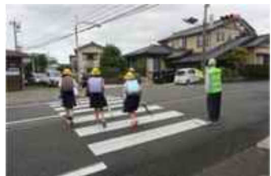
登下校時の見守り隊の活動

保護者、教職員及び見守り隊に、中学生が作成した安全運転啓発のための広報用品を配布し、地域の交通事故防止の機運を高めます。