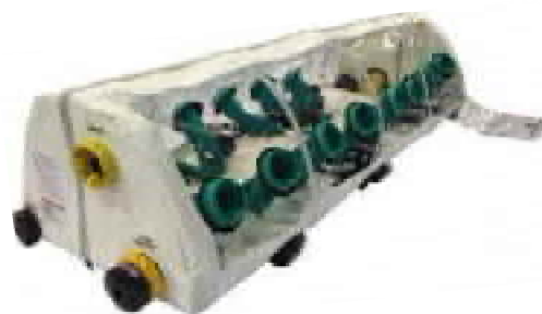
陰圧式患者搬送用器具のイメージ