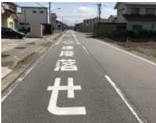
車両に減速を促す路面表示

また、警察との新たな連携施策(ゾーン30による低速度規制と物理的な仕掛けとの組み合わせ)に取り組み、安全・安心な道路空間を整備します。