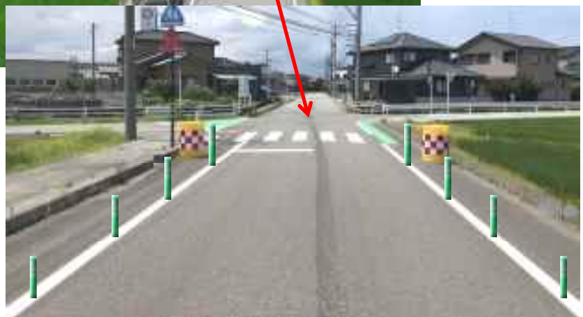
ラバーポールの設置イメージ