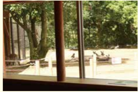
ガラスの透明化で視認性がアップ