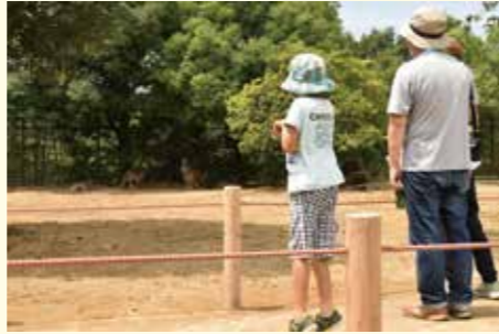
ウォークインゾーンからカンガルーを見る

※ウォークインゾーンの解放時間／11時～12時、14時～15時 雨天時は解放しませんので、ご了承ください。