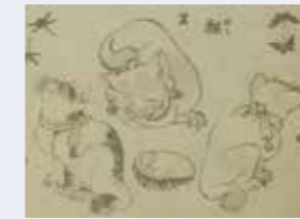
葛飾北斎「三体画譜」猫