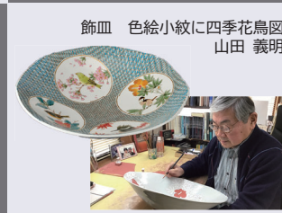
飾皿 色絵小紋に四季花鳥図 山田 義明