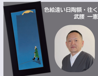
色絵遠い日陶額・往く武腰 一憲

市民の方は、能美市へ寄附していただいても返礼品を受け取ることはできません。市外のご友人やお知り合いにぜひご紹介ください。