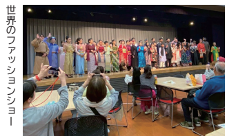
世界のファッションショー

10月19日、辰口福祉会館で「国際交流ひろば」が開催され、約900名が多彩な催しを満喫しました。世界のファッションショーでは老若男女が色彩豊かな民族衣装姿で舞台上に勢ぞろいし、外国人カラオケでは出場者が祖国の民族音楽や日本の演歌を踊りや