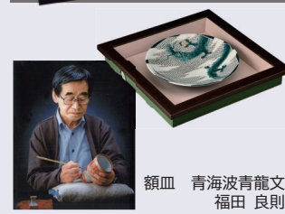
額皿 青海波青龍文 福田 良則