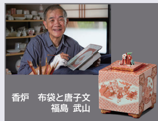
香炉 布袋と唐子文 福島 武山