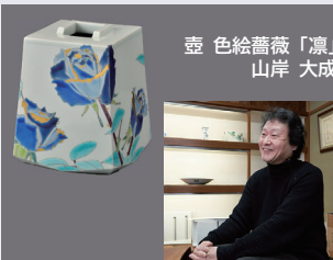
壺 色絵薔薇「凜」 山岸 大成