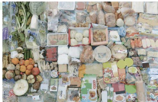
捨てられた手付かずの食品例

食品ロスの中には、手付かずの状態ですべて捨てられている食品もあり、この状況を多くの方に知っていただくことが大切です。