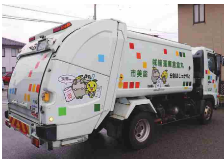
ラッピングが施されたごみ収集車

能美市ラッピング広告事業を活用したもので、ごみ収集車のラッピングは4台目になります。車両にはごみ分別を呼びかけるメッセージがラッピングされており、これから市内を巡回することで、市民の環境意識向上が期待されます。