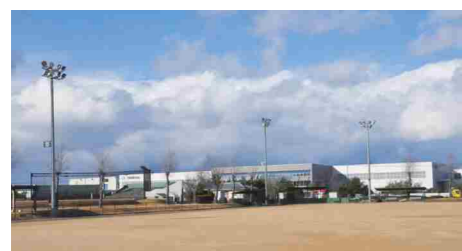
予約・施設利用についての問い合わせ先 能美市寺井体育館 ☎ 58-5973、☎ 58-5972

施設利用料は全面の場合1時間1040円、片面の場合は1時間520円となります。夜間の利用が可能となったこと