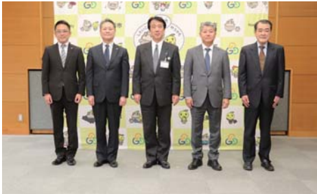
本社機能立地促進補助金は、計1,520万円を交付しました。

住田鉄工所(山口町)、(株)中東(岩内町)、(株)T・T・O(山口町)、テックワン(株)(旭台)、(株)東振精機(粟生町)、東レ(株)(北市町)、日本ガイシ(株)(能美)、日本通運(株)(能美)、日野トレーディング(株)(赤井町)、米田ニット(株)(山口町) 本社機能立地促進補助金は、本社機能施設等を市外から移転及び拡充を行った企業に補助するものです。今回は、(株)クリエート(粟生町)、技研(株)(下清水町)2社に交付しました。 産業振興奨励助成金は、市内で工場などの新設・増