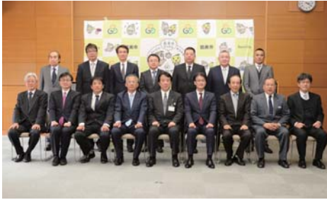
企業立地促進助成金は、計1億2,190万円を交付しました。

企業立地促進助成金は、市の産業用地等を取得し、工場等の新設・増設を行った企業などに助成するものです。今回は次の15社に交付しました。 (株)エスフーズ(山口町)、(株)金森製作所(徳山町)、川上鉄筋工業(株)(山口町)、(株)光栄(岩内町)、(株)スパ・アロイ(岩内町)、(株)