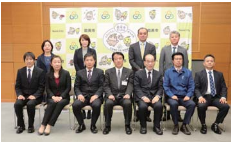
産業振興奨励助成金は計1,393万円を交付しました。

設や機械設備に一定額以上の投資を行った企業に助成するものです。今回は次の12社に交付しました。 合同会社LNSジャパン(道林町)、(株)オノモリ(上清水町)、上西鉄筋工業(株)(山口町)、(株)クマモトニット(福島町)、(株)クリエート(粟生町)、昭和プロダクツ(株)(上清水町)、(株)そごう(粟生町)、(株)タガミ・イーエクス(粟生町)、(株)ツキボシP&P(浜町)、(株)日誠産業(浜町、山口町)、(株)北陸カラーフォーム(勘生町)、北陸スチール(株)(道林町)