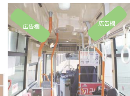
↑【のみバス車内額面広告イメージ】