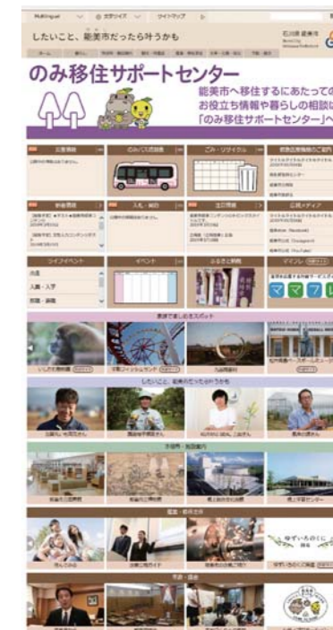
※画像は製作段階のもののため実際の画面とは異なる場合があります。