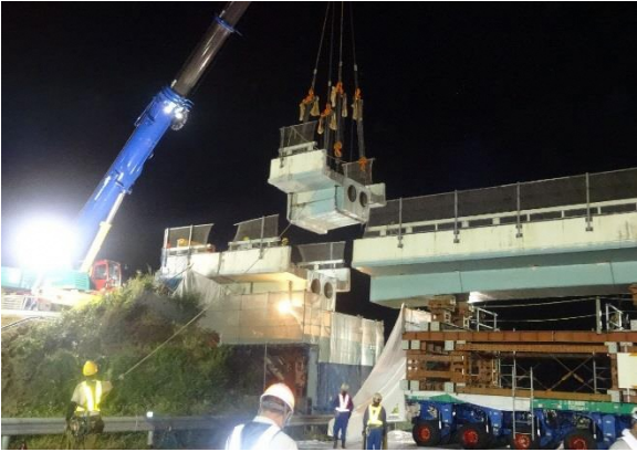
主桁(下り側径間)撤去状況