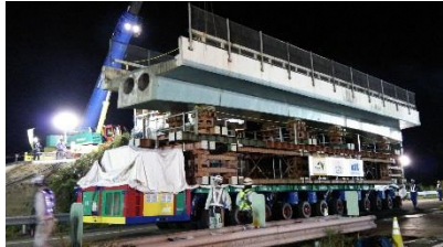
多軸自走台車による主桁撤去状況