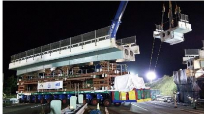
主桁(上り側径間)撤去状況