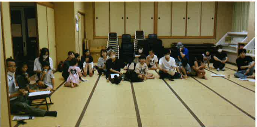
(写真2 協議会の様子)