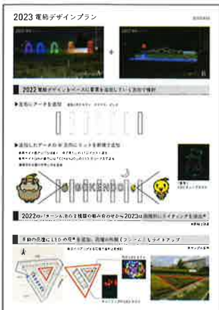
(写真1 デザインプラン)

なお、この事業は能美市と町内会のご支援により実施されています。市内の認知度も上がっており、すばらしいとの意見も多く聞かれています。