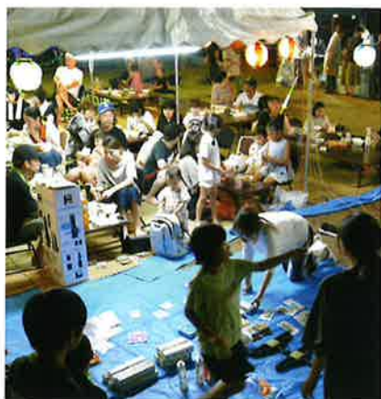
(夏まつりのピンゴゲームの様子)

4月に行われた能美線ウォーク、5月のスポーツフェスティバルinねあがり、8月完全実施の夏まつり、11月町内ポウリング大会など全て4年ぶりの開催でした。それぞれの行事の内容については、それぞれの担当者が報告していますので、そちらをご覧ください。