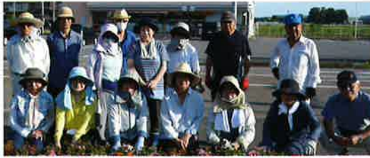
9月10日(日)の早朝草取り参加者