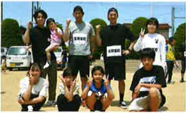
(リレーメンバーの皆さん)