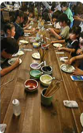
(絵付け体験の様子)

8月20日(日)午後より、14名参加で加賀伝統工芸村ゆのくにの森へ絵付け体験に行ってきました。絵付け体験では、湯のみやマグカップ、お皿などに九谷の五彩と言われる色を使って、みんなそれぞれ好きなデザインを描き、色を塗り楽しんでいました。また、塗り直したい部分や、失敗したところは布で拭き取って消し、あらためて描くことができるのでみんな安心して描けたと思います。ゆのくにの森は、工芸体験を楽しむことができる以外にも村内のいろんな所に茅葺き屋根の古民家があり非日常感を味わうことができました。村内には、オルゴールの館や「アンブレラスカイ」という色彩やかな傘を使った演出の映えスポットもあり、子供たちといろいろ見て回り楽しい時間を過ごすことができました。(寺田美希 記)