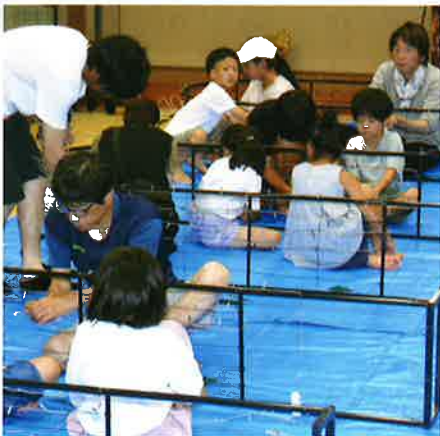
(写真3 アーチにLEDの取付け)