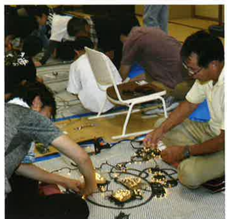
(追加造形物の作成)