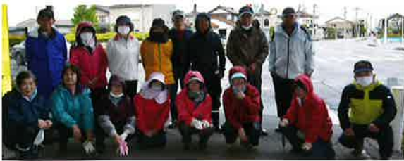
5月14日(日)の早朝草取り参加者

花壇管理は当会の有志(通称:花の会)20名のご協力によって、夏花の水やり・3度の早朝草取り・施肥を行いました。(南外志男 記)