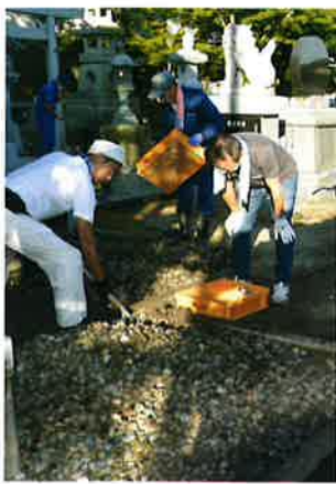
(玉石の洗浄の様子)

能美市のキャラクターの『ひぼ能ん・ゆず美ん』も加わり期待以上のパフォーマンスで、五間堂町の玄関口をにぎやかに彩ってくれています。五間堂町内だけでなく能美市として自慢できるものです。来年も更なるパフォーマンスが期待されていると思われます。