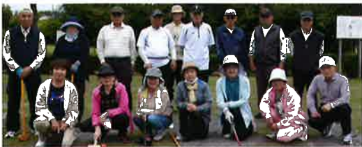
▼第13回の参加者・関係者