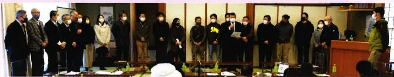
↑ 令和5年度 新役員の皆さん