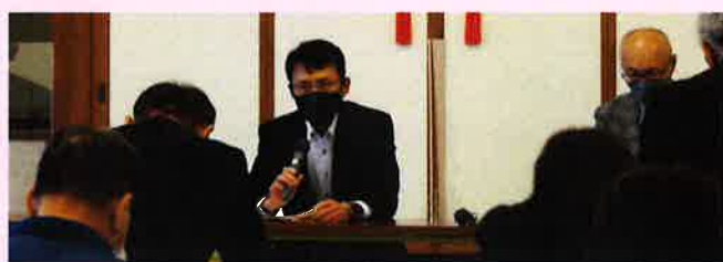
防災担当による 自主防災会議案説明