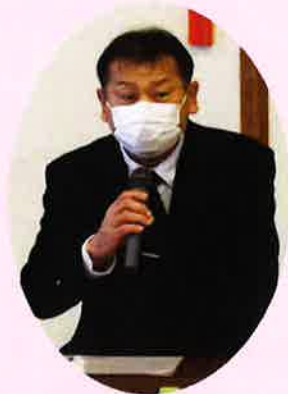
新町内会長あいさつ