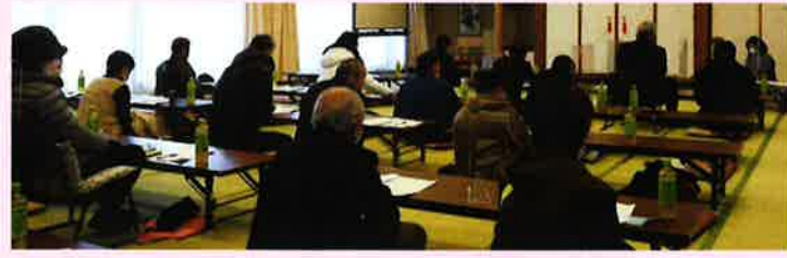
↑ 前年度 事業報告