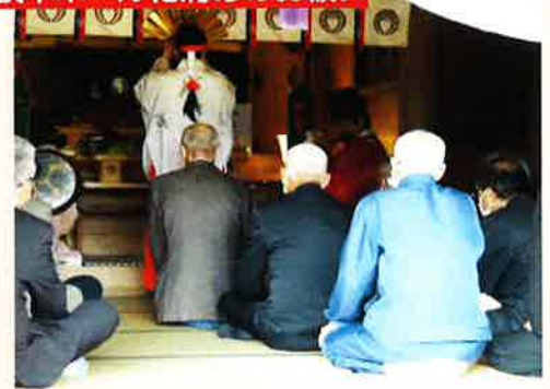
10/8 旗木ポール化清めのお祓い