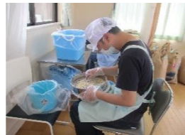
「大麦ご飯の素」作業