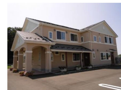
キッズ MOMO 外観