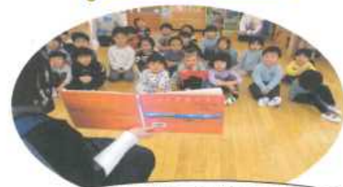
図書館の方による読み聞かせ