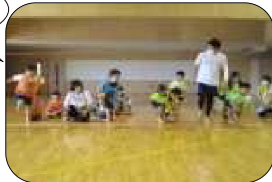
体操教室 ～子ども育成体験推進事業～