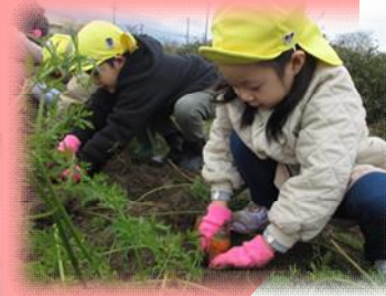
地元の野菜 赤井にんじん収穫