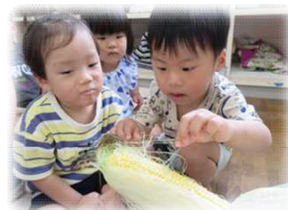
トウモロコシの 皮むき