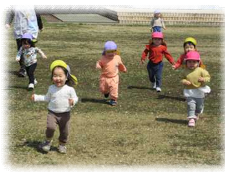
園庭で「よーいドン！」