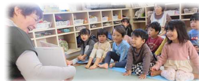
図書館の方によるおはなし会