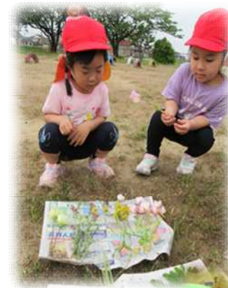
園庭で野花を 摘んだよ！