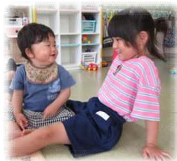
「お姉ちゃんと一緒に 楽しいね！」