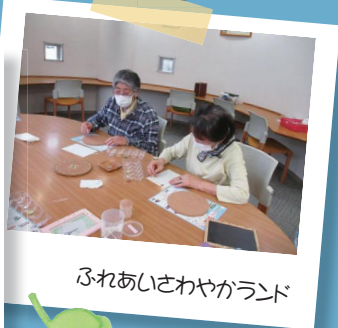
ふれあいさわやかランド