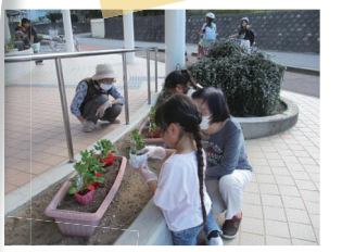
地域の方と花植え