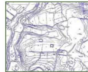
旧地形図・旧空中写真