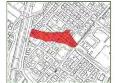
盛土造成地の位置の把握