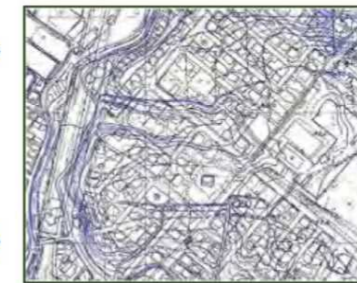
重ね合わせによる判定