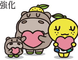
のみ リブ&ハート アクションプラン